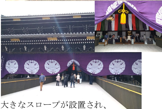
大きなスロープが設置され、 牡丹の柄の幕をくぐって御影堂へ