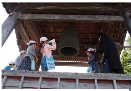
まち探検では、鐘つき体験も

当初は八番学校という名で、学制発布の翌年（1873年明治六年）に天童で最も早く開校、 （この年に県内で22校が開校したようです。）最初期の数か月、願行寺の一室が学び舎だった そうです。早世された当時の先生のお墓が本堂の南西角あたりにあります。高揃小の子達が 時々訪ねてきてくれます。